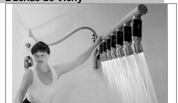
Duchas de Vichy