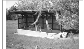
Baños de Kneipp